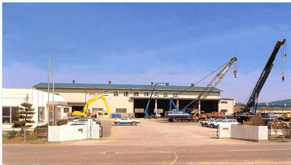
三協建機(株) 本社工場